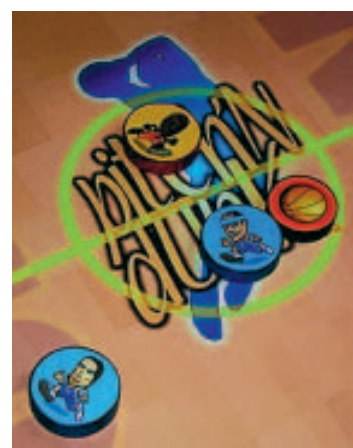
Il ressort... à 200 exemplaires.