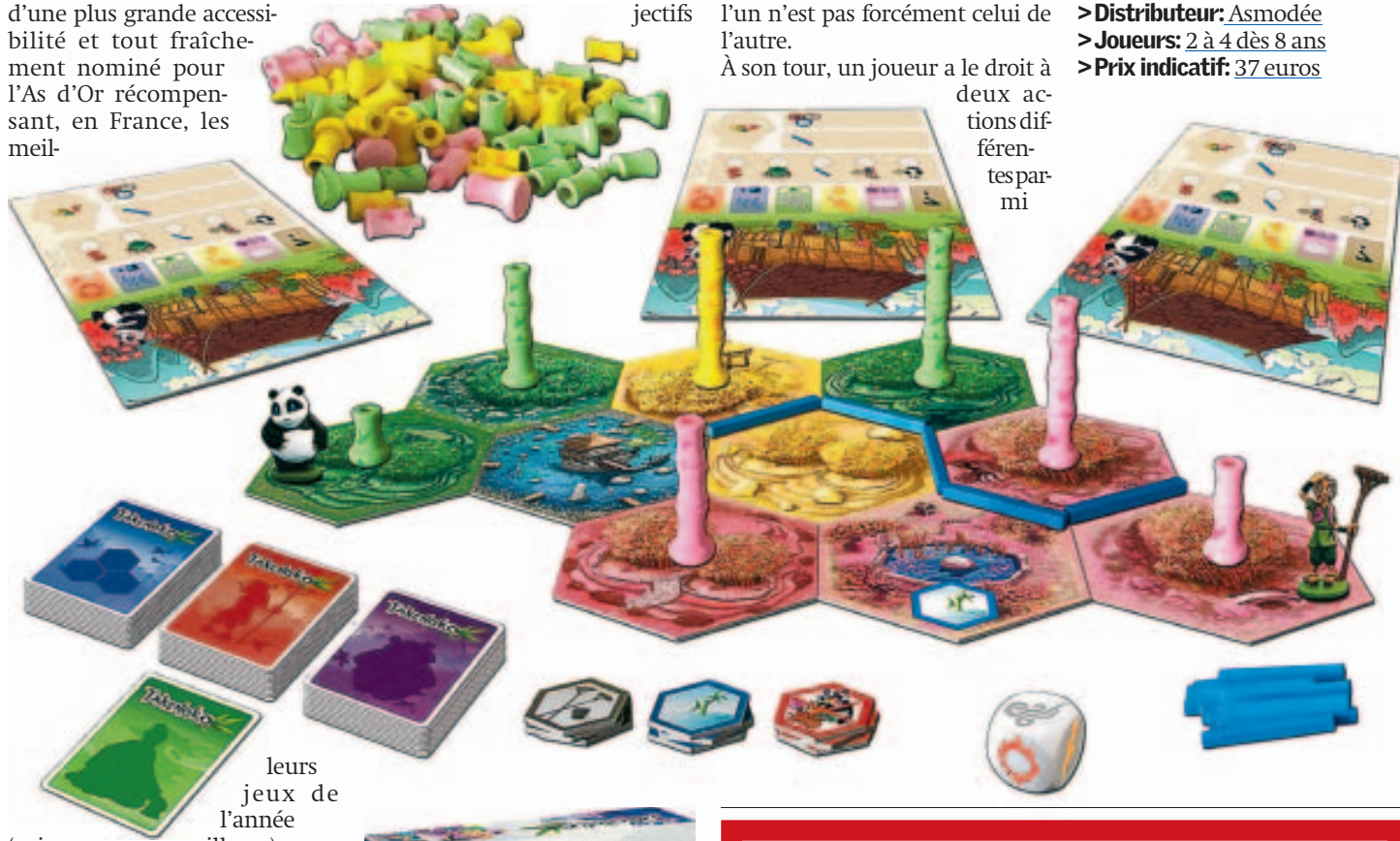
leurs jeux de l'année ailleurs.

On est ici dans du jeu léger, familial, avec des objectifs assez faciles à réaliser, mais dans un concept qui peut servir de bonne introduction, pour les enfants de 8 ans et plus, aux jeux tactiquement plus profonds. Vous vous retrouvez donc à la tête de l'empire du Japon. C'est peu probable, mais faisons comme si. Et votre homologue chinois vient de vous offrir un petit panda, un vrai de vrai, pour sceller la réconciliation entre les deux puissances. C'est sympa un panda, mais c'est comme le chien, il faut s'en occuper. Il faut surtout lui donner à