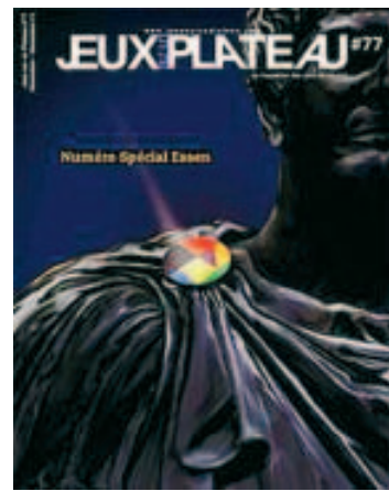
La dernière couverture de JSP.